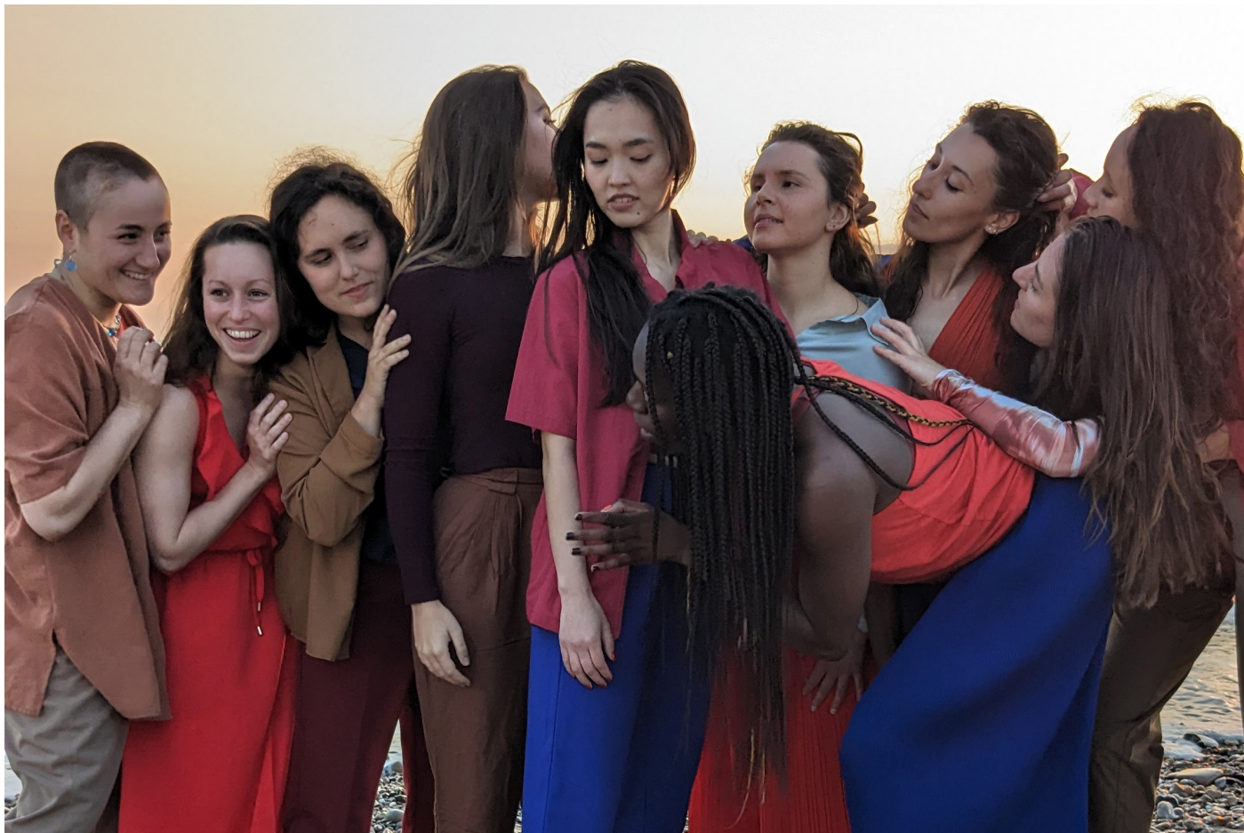
© Le Phare - CCN du Havre Normandie